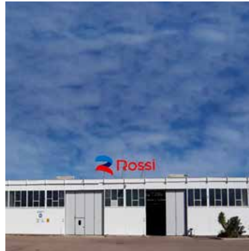
Planetary Division facilities Lecce - Italy