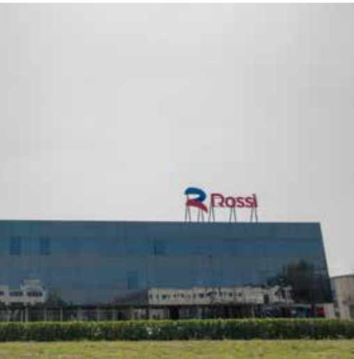
Rossi Sede e centro di montaggio Modena - Italia