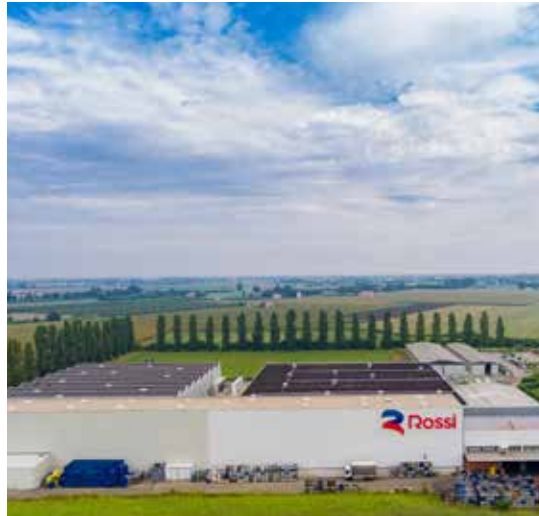
High precision manufacturing facility Ganaceto (Modena) - Italy